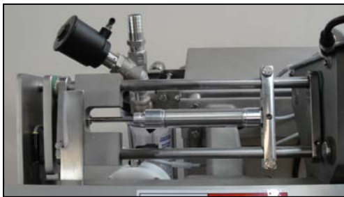
Tensadores de bolsas opcionales